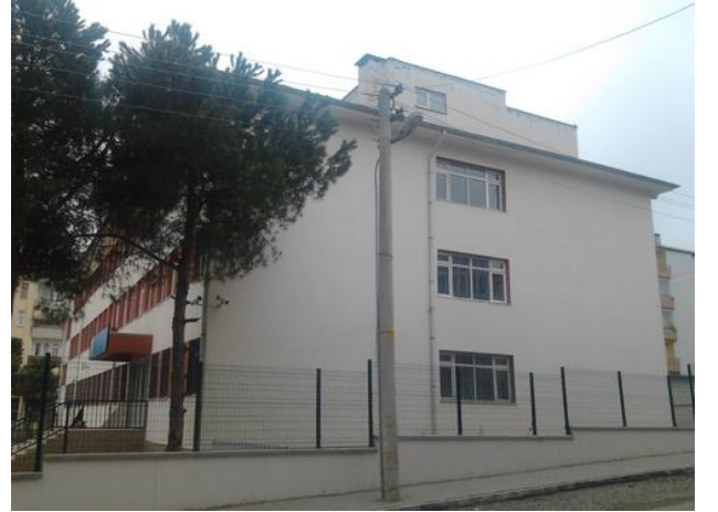
Okul Binası Sağ Taraftan Görünümü