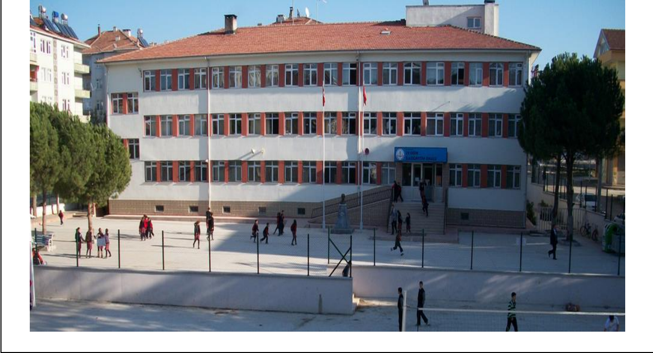
29 EKİM İLKOKULU