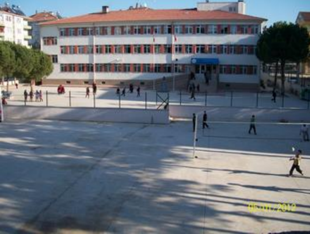
Okul Binası Önden Görünümü ve Okul Bahçesi