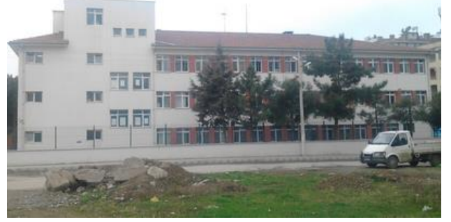
Okul Binası Arka Taraftan Görünümü