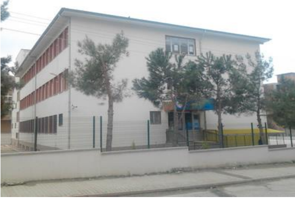
Okul Binası Sol Taraftan Görünümü