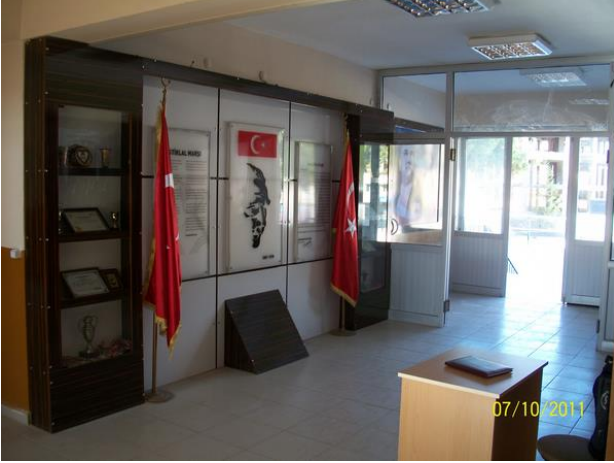
Okul Girişi ve Atatürk Köşesi